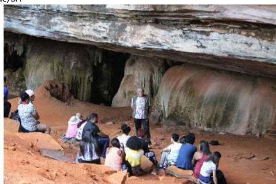
Foto: Prof. Gemicrê do Nascimento Silva, 2018, Chapada Diamantina/BA