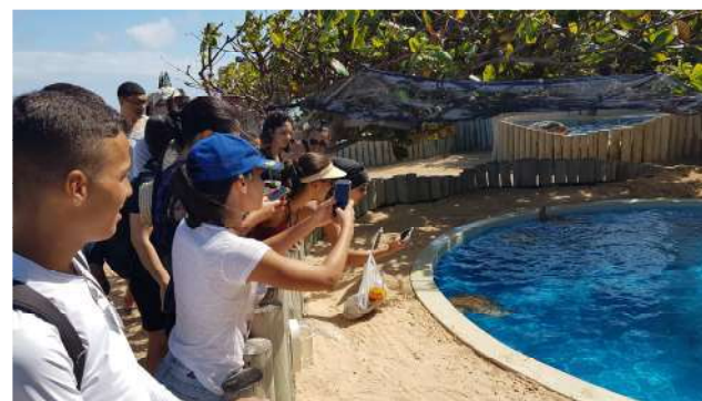
Foto: Prof. Carlos Wallace do Nascimento Moura, 2018, TAMAR, Praia do Forte/BA