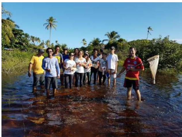
Foto: Prof. Carlos Wallace do Nascimento Moura, 2017, Aldeia Hippie, Rio Capivara Grande/BA

As atividades de campo são utilizadas pelos componentes curriculares cujo o conteúdo permitam a exploração de ensino-aprendizagem e se apresentam nas modalidades aulas de campo, visitas técnicas e/ou excursões. Podem participar das atividades de campo, docentes e técnicos de nível superior da UEFS e discentes regularmente matriculados na Instituição.