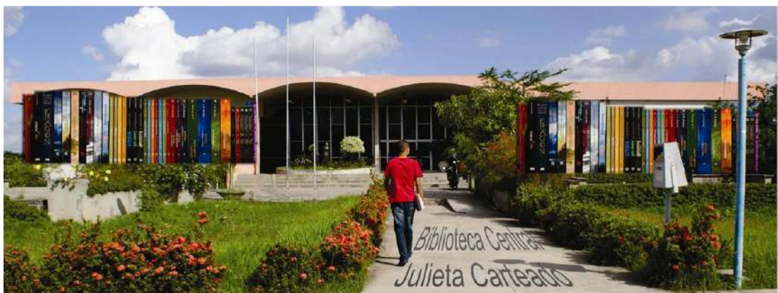
Fonte: Fachada da Biblioteca Central Julieta Carteado. Foto: ASCOM/UEFS. 2012.

O Sistema Integrado de Bibliotecas da UEFS - SISBI-UEFS foi criado no ano de 1997 tendo como objetivo integrar as ações informacionais da UEFS e subsidiar o desenvolvimento das atividades de ensino, pesquisa e extensão. Possui as funções de organizar e disseminar a informação, apoiado em novas tecnologias de acesso, para subsidiar o ensino, a pesquisa e a extensão, visando contribuir para o desenvolvimento educacional e cultural.