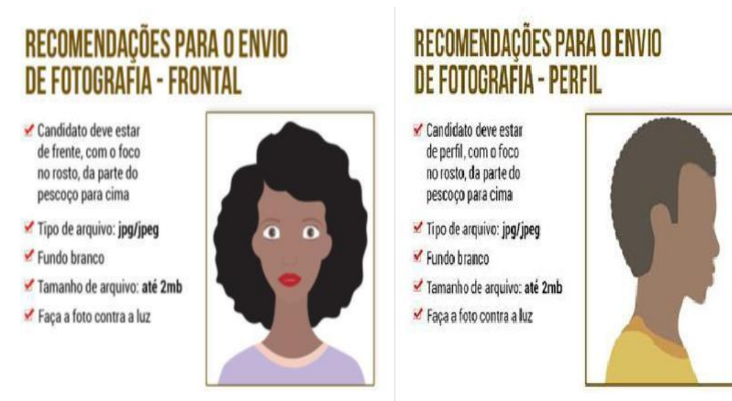
IMAGEM 4 – PROTÓTIPOS PARA ENVIO DE FOTOGRAFIAS