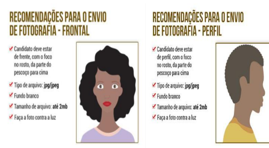
IMAGEM 4 – PROTÓTIPOS PARA ENVIO DE FOTOGRAFIAS

Fonte: Internet -Referências das imagens (05)