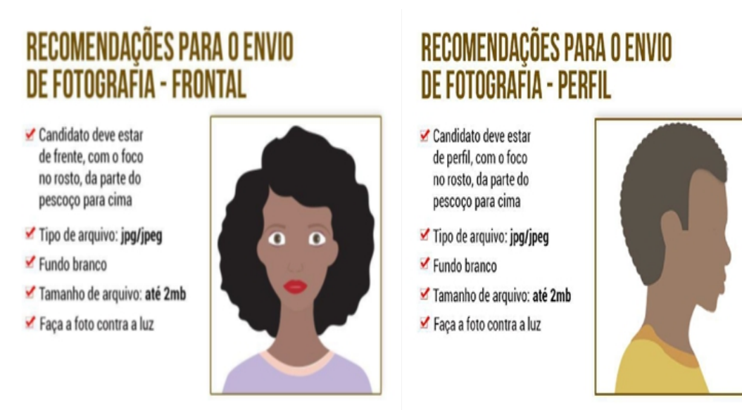
IMAGEM 4 – PROTÓTIPOS PARA ENVIO DE FOTOGRAFIAS