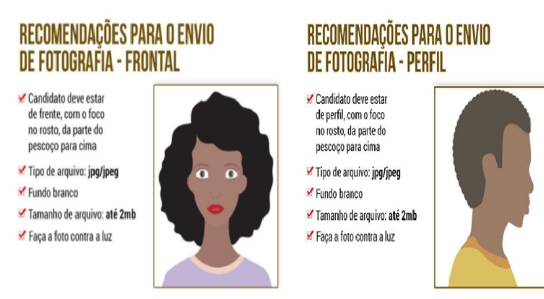
IMAGEM 4 – PROTÓTIPOS PARA ENVIO DE FOTOGRAFIAS