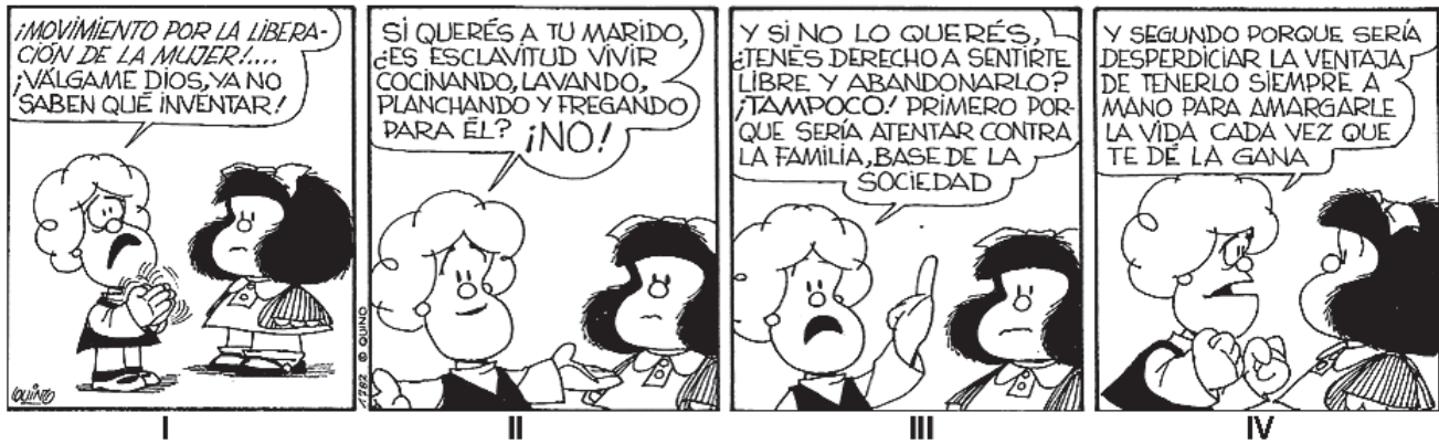
LAVADO, Joaquín Salvador (QUINO). Toda Mafalda . Barcelona: Editorial Lumen. 1992. p. 454.