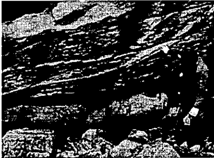
The groove was made by the tail of the animal as it dragged over the sand

A mold is being made of tracks left by a two-meter long ancient animal in north east Fife