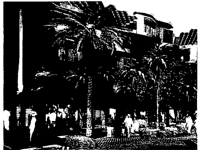
Abu Dhabi's revolutionary new eco-school looks to a future beyond oil.

The rulers of Abu Dhabi have seen the future, and it's not oil. The evidence of that is everywhere in this petro-empire — from gleaming solar panels to the hundreds of billions of dollars invested in diversified foreign assets.