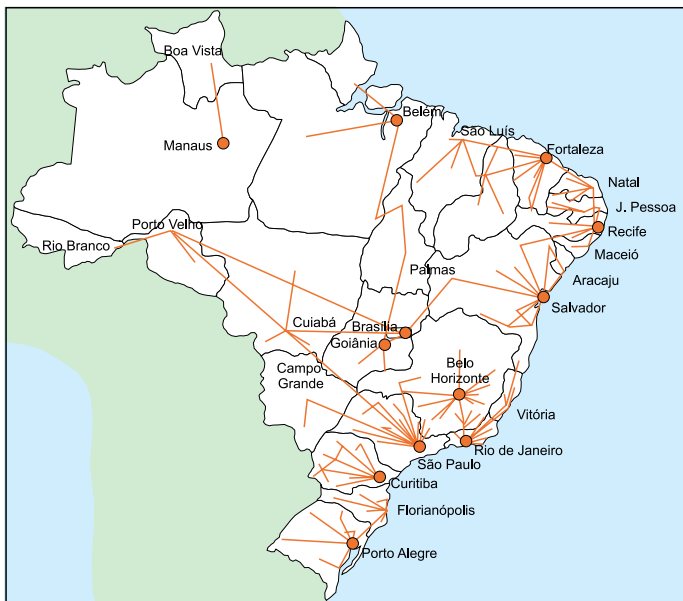
(Graça M. L. Ferreira. Atlas geográfico , 2013. Adaptado.)

Considerando as cidades e a urbanização brasileira, é correto afirmar que o mapa apresenta